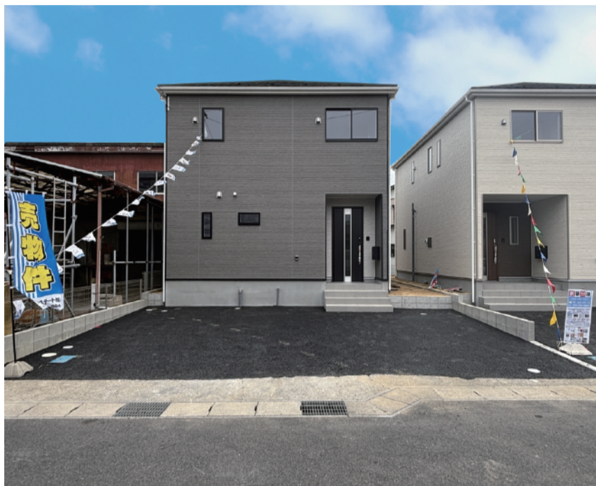
前面道路広く駐車も楽々!