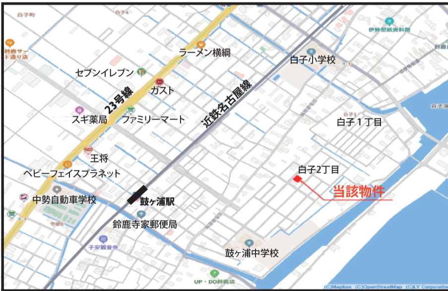
現地案内図 カーナビポイント 三重県鈴鹿市白子2丁目22-18付近