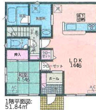
1階平面図: 51.84m 2